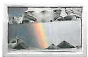
レインボー 7色の虹とやさしい色のフレームがとても印象的な作品です。