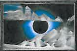
コロナ わずかしか見ることのできない皆既日食の瞬間をみごとな作品に仕上げました。

W4(S) 22cm × 33cm ¥9,240(税込) W5(M) 29cm × 42cm ¥13,440(税込) W6(L) 41cm × 56cm ¥47,250(税込) W7(XL) 50cm × 70cm ¥69,300(税込) ※Sサイズはスタンドにもできます。