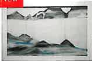
グッドモーニング 背景は真珠貝の効果を模倣しました。ソフトで女性らしい作品です。