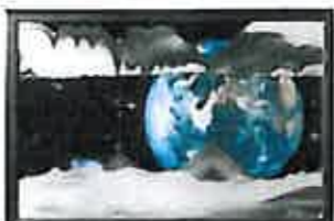
アース アポロ17号が撮影した有名な写真を題材にしています。