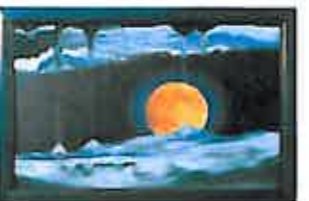
ムーン どこかの惑星から月を眺めている様子を描いています。