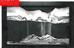
ミッドナイト ドバイの砂漠の砂を混ぜています。フラットなフレームを使用することで、モダンなスタイルを追求しました。