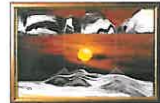
ゴールドサン 太陽を砂漠の真ん中で眺めているような力強い作品です。