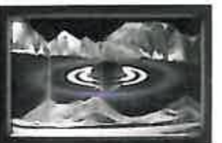
サターン 宇宙探査機カッシーニが土星の裏側を撮影した写真を用いています。