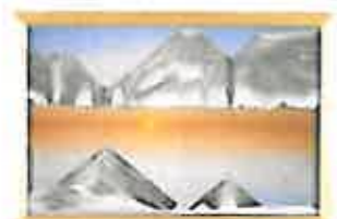
サンセット ドイツのコンスタンス湖の畔から眺めた穏やかな風景です。