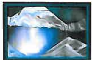
オーロラ 雪山の向こうには神秘的なオーロラを眺めることができます。